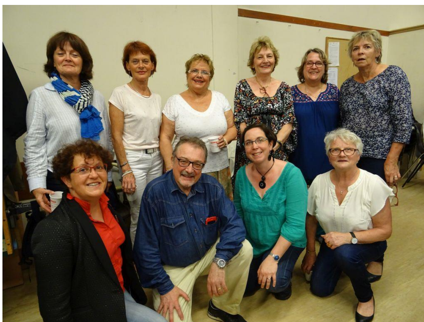
Les membres du conseil d'administration

Le groupe « communication » s'est réuni 2 fois cette année (07/09/17 et 30/01/18).