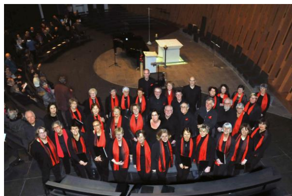
20/01/2018 Vernissage de l'exposition des œuvres de Maître Akeji à la cathédrale de Créteil