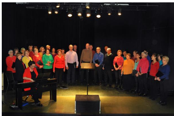
18/11/2017 Concert à la MJC Village